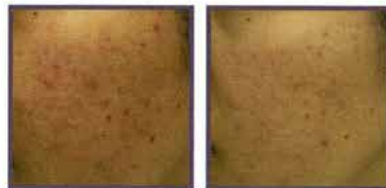
図5 NIKKOL VC-IP のアクネ改善作用 (写真)