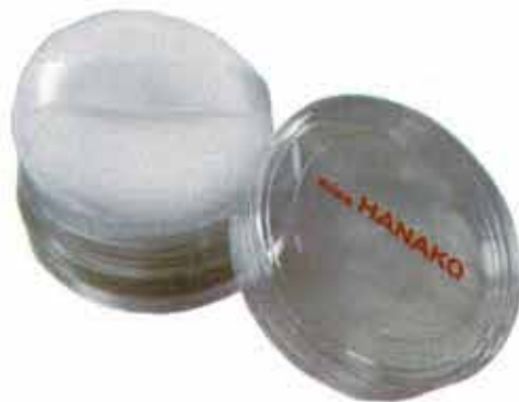
miss HANAKO キュアパウダー 定価 8,000円(税別) / 容量 7g

ヒレハウリ草根より抽出される生薬で、傷や潰瘍に用いられています。化粧品に配合することにより、他の成分の刺激や、アレルギーを引き起こすような成分の刺激を防ぎ、肌荒れ・傷をきれいにします。